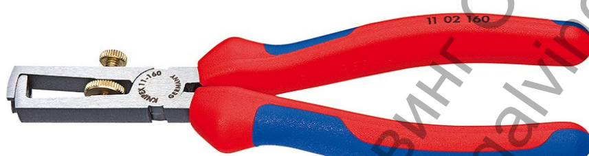
11 02 160 Полирана глава, двукомпонентни ръкохватки